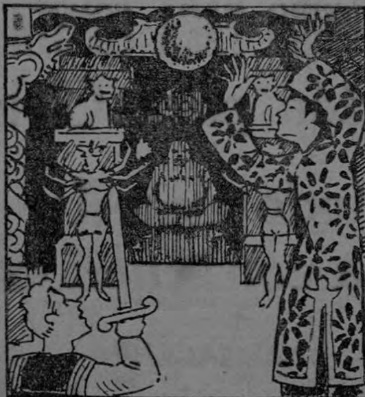
BAJO EL INFLUJO MAGICO DEL MAGO, LA BOLA ANDA POR LOS AIRES, EL MARINO CONTEMPLA, ASOMBRADO EL MILAGRO