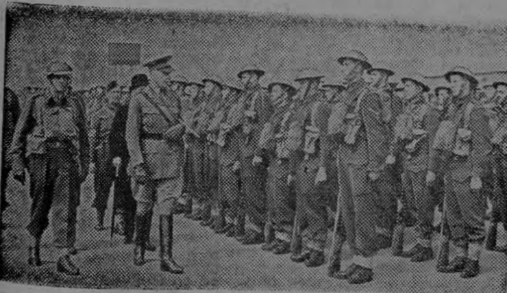
El conde de Athlone, nuevo Gobernador General del Canadá, pasa revista a una tropa canadiense, en Inglaterra.