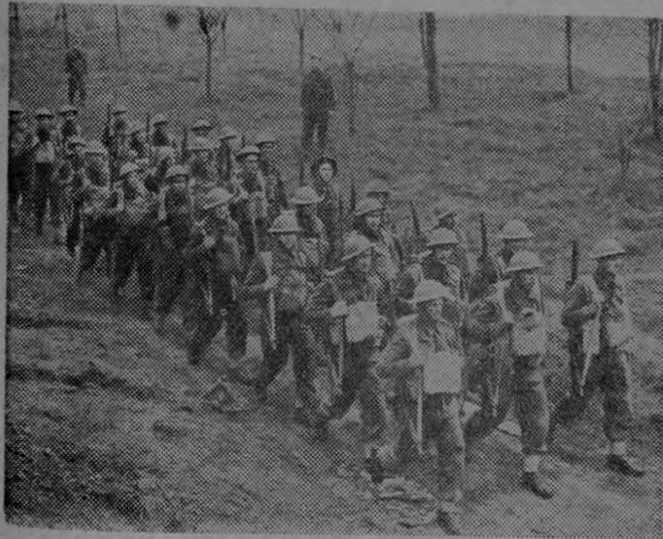
Un relevo de tropa Británica en marcha hacia el frente en un lugar en el sur de Inglaterra'