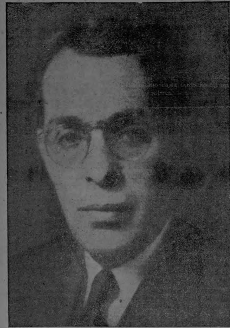
Excmo. Dr. don Eduardo Santos,

Presidente de Colombia, cuya gestión administrativa aplaude en forma unánime la ciudadanía colombiana.