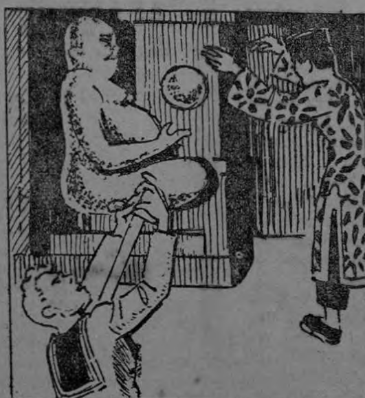
FU-MANCHU ENTREGA LA BOLA DE ORO AL DIOS, EL MARINO EN EL COLMO DEL TERROR, SE MATA, CLAVANDOSE LA ESPADA.