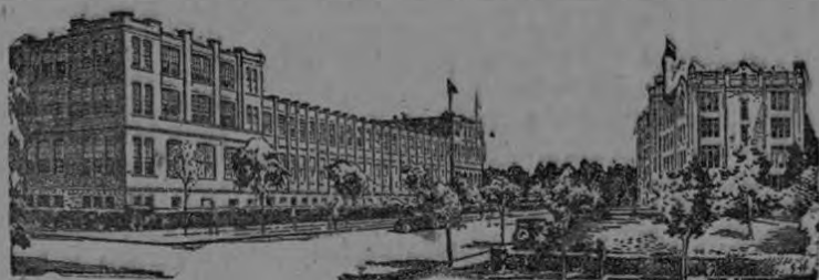
(La Universidad que le enseña a Ud. en su propia casa por correo)