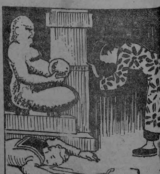
LOS DIOS SONRIEN AGRACEDIDOS AL PODERO, SOY MAGICO FU-MANCHU.